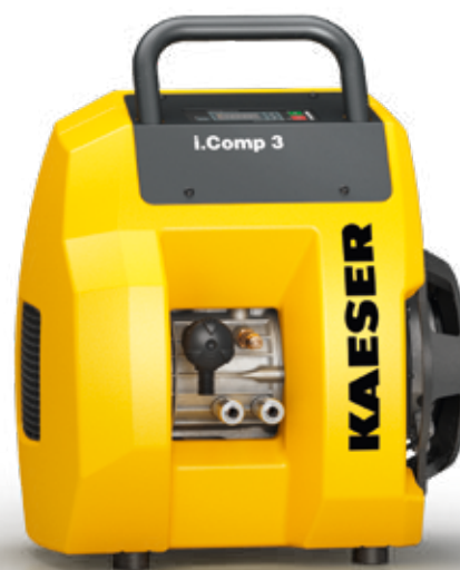
Slika: i.Comp 3