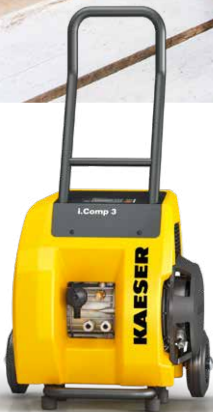
Slika: i.Comp 3

Iznimno pogodan za prevaljivanje većih udaljenosti