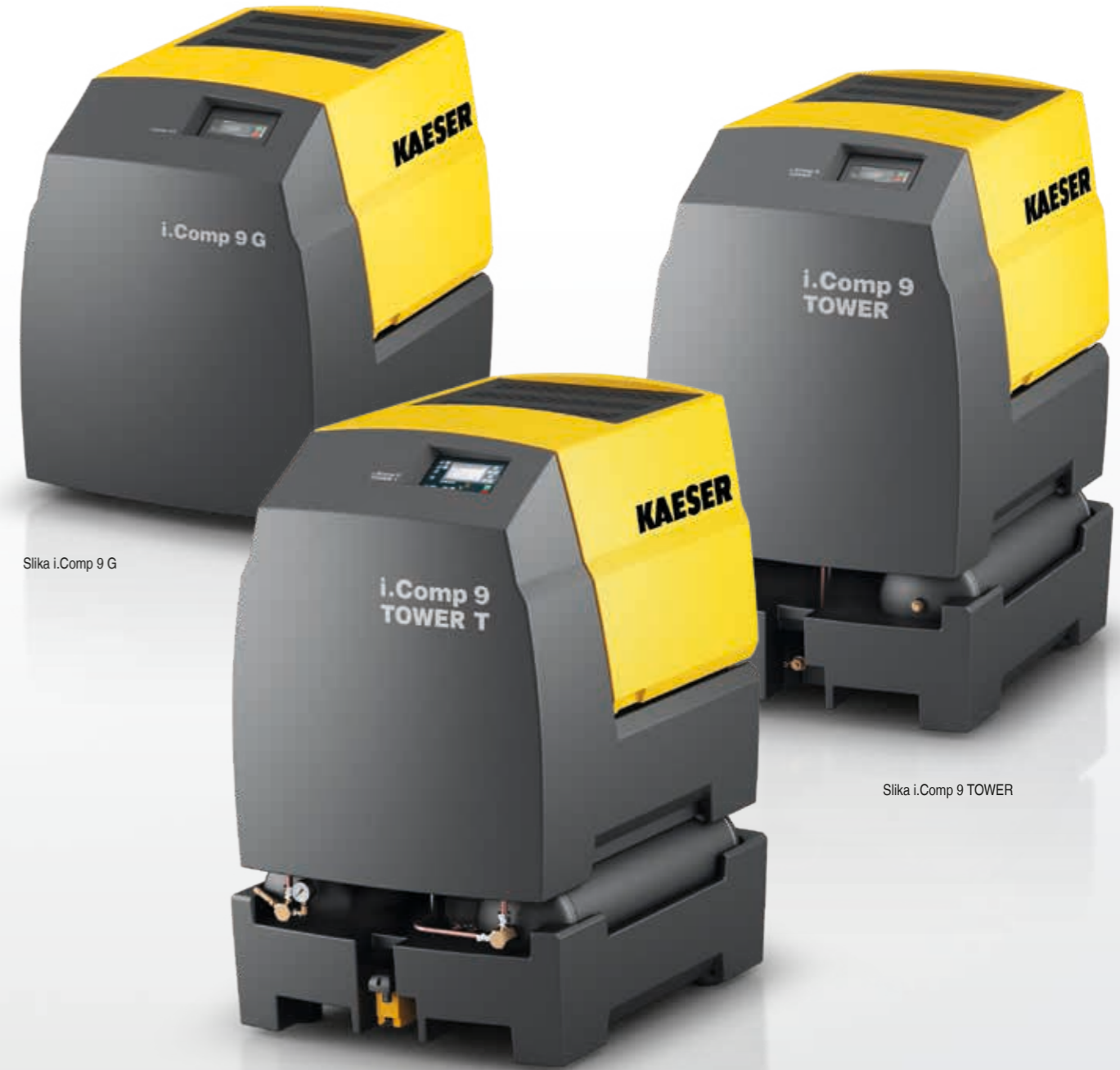
Slika i.Comp 9 G