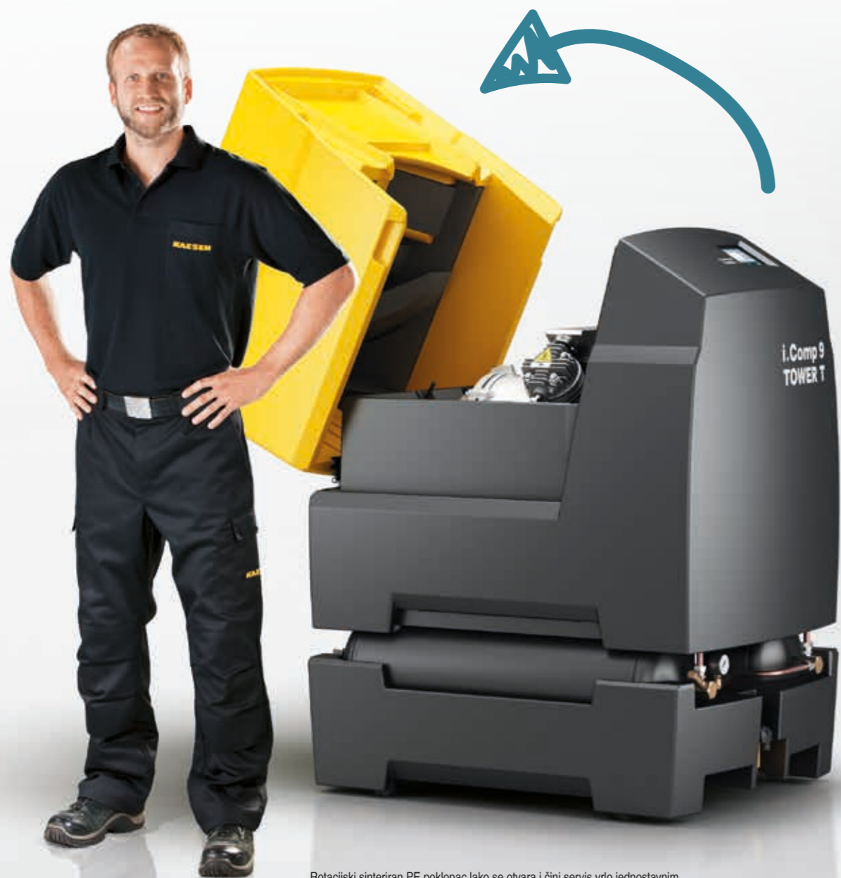
Rotacijski sinteriran PE poklopac lako se otvara i čini servis vrlo jednostavnim.

Plug and play – za rad kompaktne kompletne stanice za komprimirani zrak potrebni su samo strujni priključak i veza s mrežom komprimiranog zraka. Nisu potrebni dodatni radovi prilikom postavljanja. Energetska učinkovitost, jednostavan servis, dugovječnost i optimalna usklađenost svih komponenti omogućuju dugogodišnju pouzdanu i ekonomičnu upotrebu.